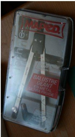
Les Créations de Marie www.lescreationsdemarie.fr

Faites un gabarit, reporter 6 fois la forme. Coudre bord à bord.