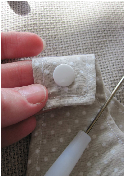
2° On pose la pression avec le pic traversant le tissus