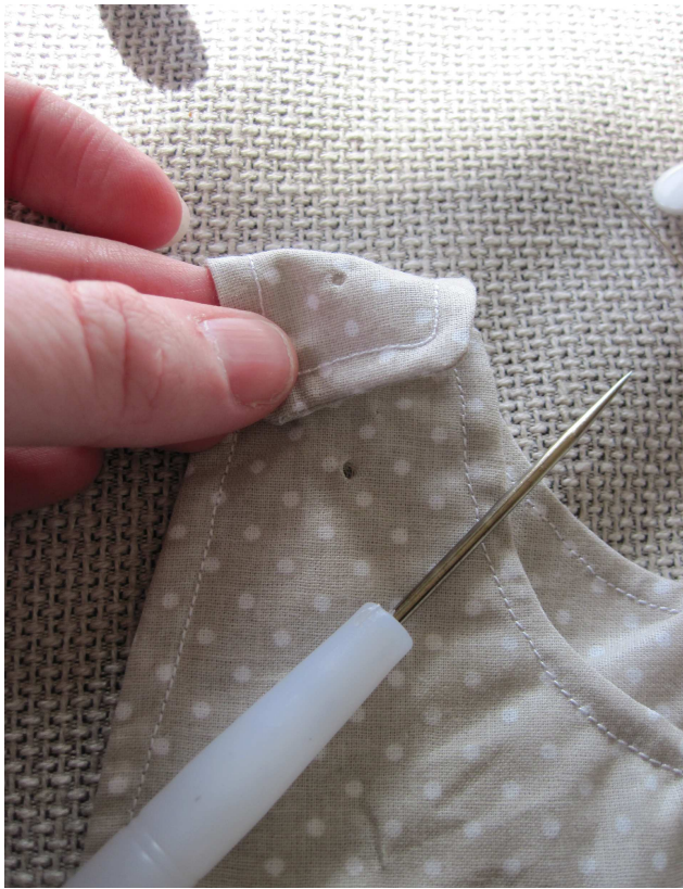
1°) On poinçonne